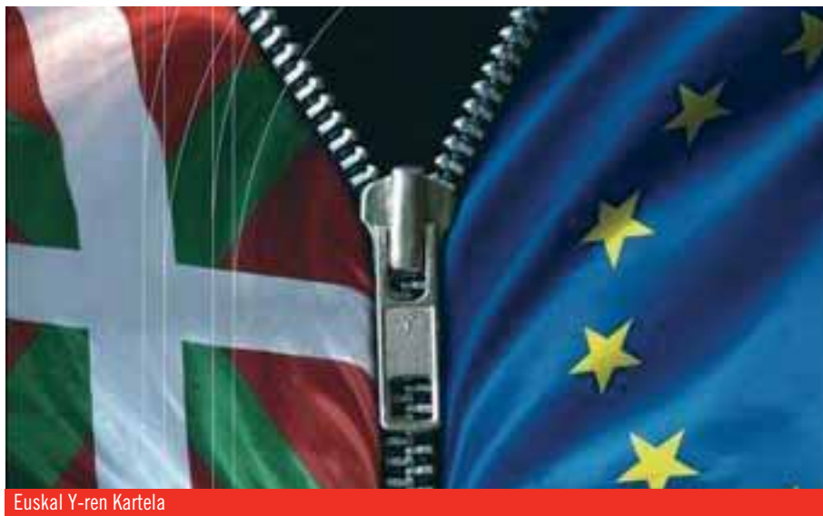
Euskal Y-ren Kartela

País Vasco, sino de la propia red de ferrocarriles españoles.