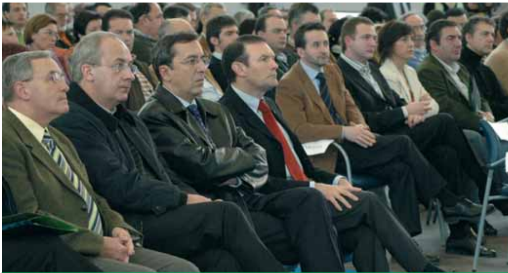
Dirigentes políticos estuvieron presentes en la IV Asamblea de Udalbide

En 2004 desarrollamos el proyecto esencial de la asociación. Su objetivo es el fortalecimiento de un país dividido en tres esferas administrativas a ambos lados de la frontera. Que el euskera pueda tener un futuro en Iparralde, que podamos encontrar nuestro lugar en la Europa del mañana y que podamos fortalecer los rasgos que hacen que nuestro país sea un país. Nos corresponde asimismo fortalecer los proyectos locales que desarrollen la condición vasca tanto en Ziburu como en Artajona. Por tanto, son miembros de nuestra asociación, en Iparralde, la federación de ikastolas SEASKA, la Cámara Agraria o Ikasbi, y en Navarra, las ikastolas de la Ribera, Irujo Etxea o Euskara Kultur Elkargoa.