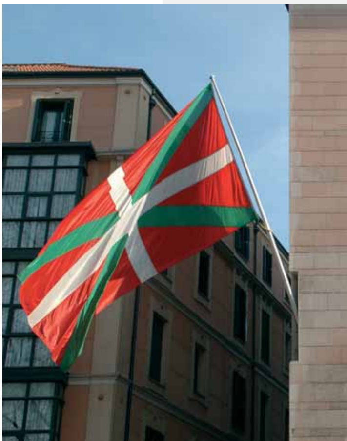
Sabin Etxeko Ikurriña

Eta hau guztia, jakina, indarkeriarik, mehatxurik eta estortsiorik ezean, eta parte hartu nahi lukeen ezein indar politikorik kanpoan uzteke.