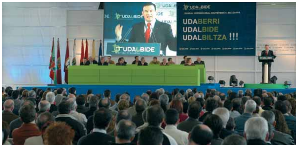
Ibarretzek Durangon burutu zen Udalbideren Biltzarrari amaiera eman zion

En septiembre de 1999, testigos de un momento político peculiar, asistimos a la creación de UDALBILTZA por parte de los cargos electos municipales de la izquierda abertzale vigente en aquella coyuntura política, de EA y de EAJ-PNV, como expresión de la integridad nacional de Euskal Herria y la colaboración entre los distintos territorios que conforman nuestra nación.