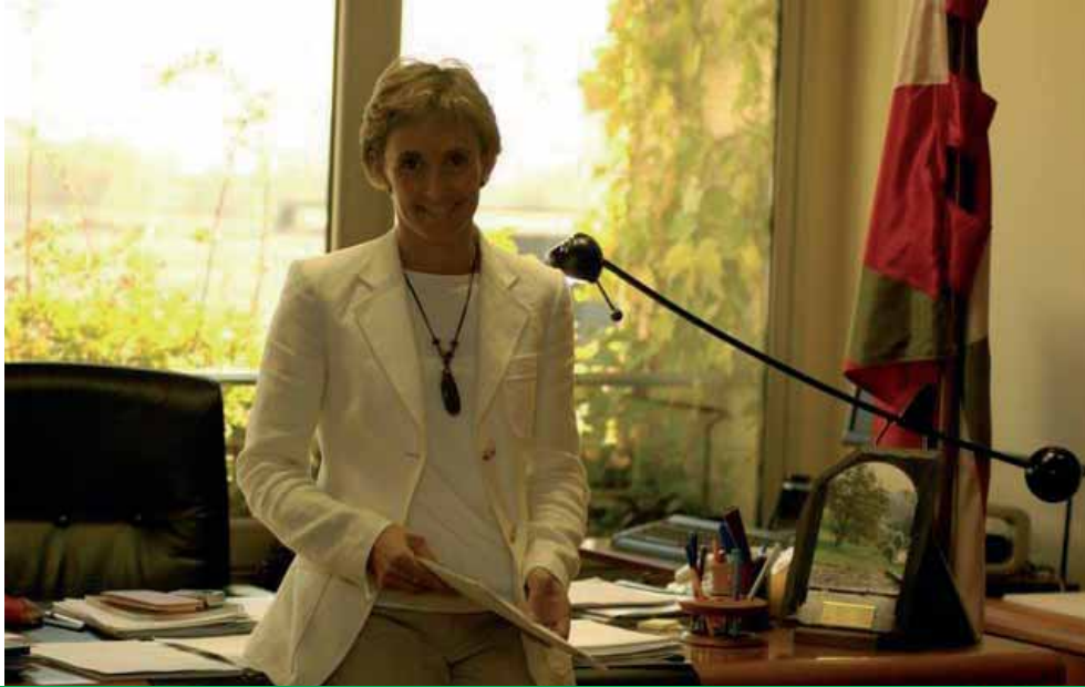
La consejera de Transportes del Gobierno Vasco, Nuria López de Guereñu

Hay que potenciar el tren – afirma Nuria López de Guereñu, consejera de Transportes y Obras Públicas del Gobierno Vasco – La sostenibilidad del desarrollo de nuestra sociedad exige modos que sean eficaces, rápidos, confortables y que no derrochen energía ni otros recursos naturales como el espacio. Especialmente en nuestro país que es pequeño. Por eso ahora toca invertir en ferrocarril.