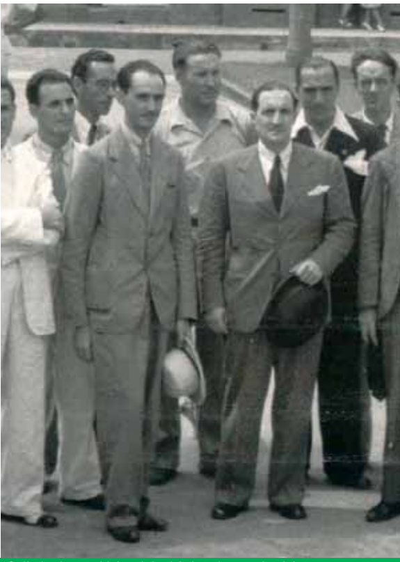
Galíndez junto al lehendakari Agirre durante la visita de éste a la República Dominicana en 1942

El día 12 de Marzo de 1956 desapareció Jesús de Galíndez, delegado del Gobierno Vasco en Nueva York y profesor de la Universidad de Columbia. Todos los demócratas del continente americano señalaron como autor del secuestro y asesinato a Trujillo, el dictador de la República Dominicana. Se le consideró el primer desaparecido público de una dictadura.