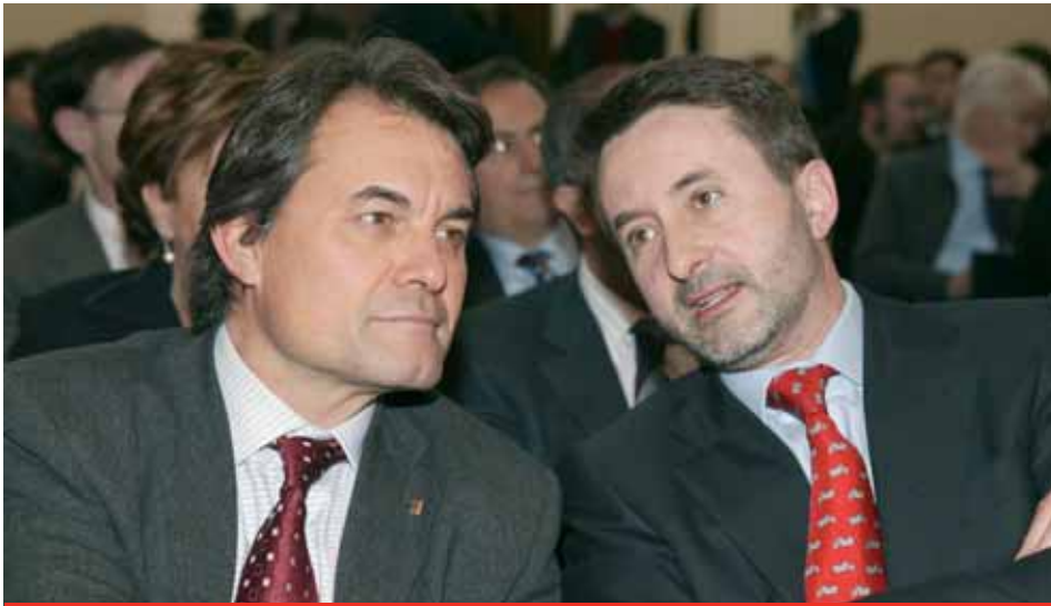
Artur Mas eta Josu Jon Imaz Tribuna Galeuscat-en aurkezpenean izan ziren