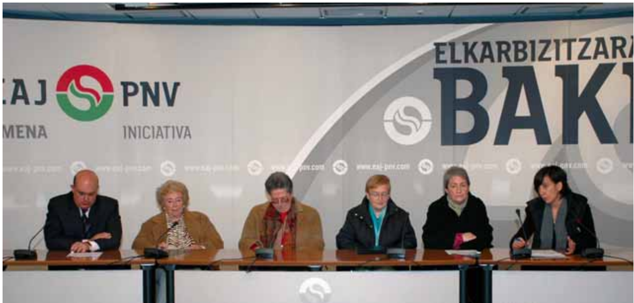
Klandestinitate garaiko andereñoek EAJk eskainitako laguntasuna eskertu zuten Sabin Etxean

Es bien sabido que el de las pensiones es uno de esos grandes temas en los que el Estado, incumpliendo una de las Leyes orgánicas por él mismo aprobadas hace lo del perro del hortelano. Ni hacer, ni dejar hacer. La gestión y administración de las prestaciones económicas del sistema de la Seguridad Social, está asignada en el Estatuto de Gernika a la CAPV pero los gobiernos sucesivos del Estado se niegan a transferir esta competencia.