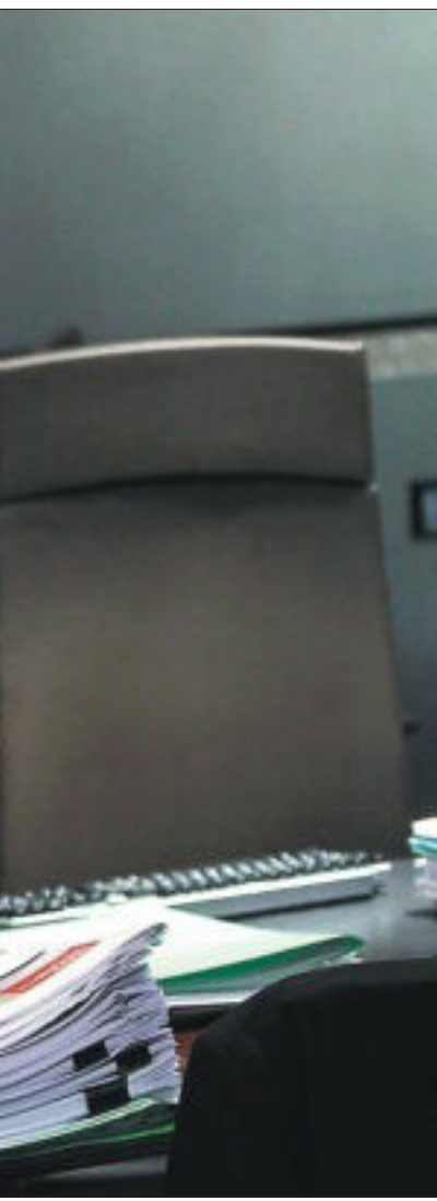
El presidente del PNV, Iñigo Urkullu, posa junto a varios documentos en la mesa de trabajo que tiene en su despacho de Sabin Etxea.

En el manifiesto, hecho público durante la presentación, han destacado que “vemos, no si dificultades, que estamos ante un tiempo lleno de oportunidades” y que “día a día se están dando pasos hacia el cambio político y social”.