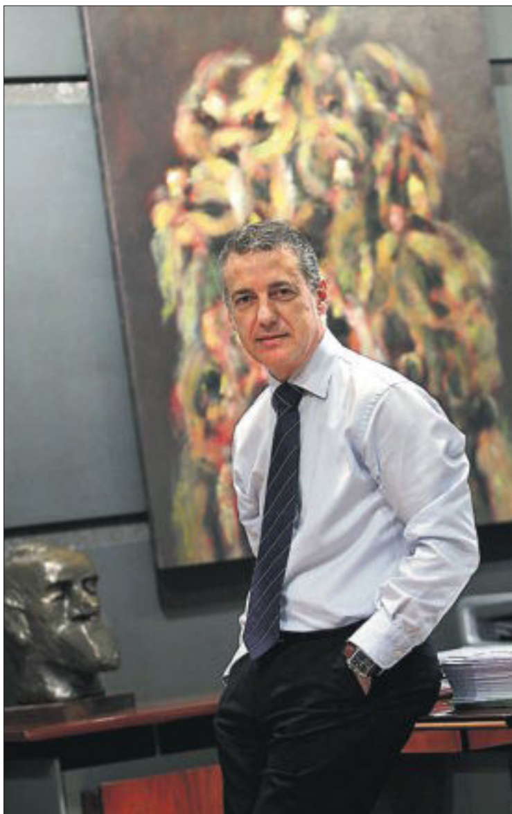
Iñigo Urkullu, el pasado viernes, en Bilbao.

Precisamente, la política penitenciaria es un asunto nuclear para la acción política en Euskadi. El presidente del PNV asume que Mariano Rajoy “es consciente también de que estamos en otro tiempo diferente tras el anuncio de cese definitivo de