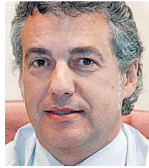
Íñigo Urkullu PRESIDENTE DEL PNV