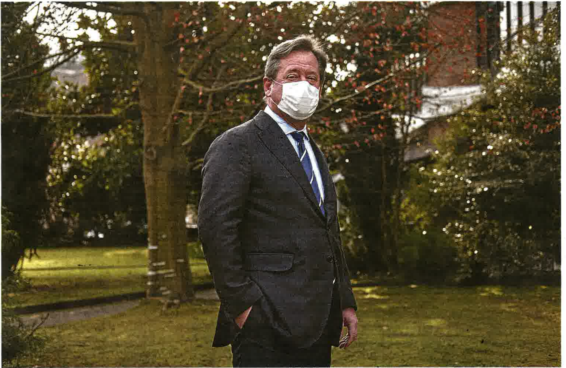
Bingen Zupiria, consejero de Cultura y portavoz del Gobierno Vasco, el pasado viernes en San Sebastián. usoz