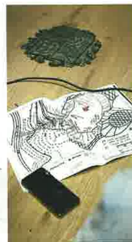
Detalle de los planos del vertedero que consultó el lehendakari.

la báscula, y que la otra persona pudiera estar en el otro extremo del vertedero, con la imposibilidad de acceder en ese momento porque todas las vías de acceso habían quedado superadas. Se trabaja con los riesgos de más desprendimientos.