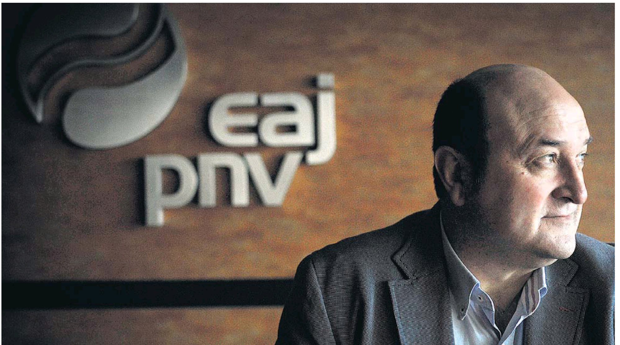
El presidente del PNV, Andoni Ortuzar, posa en Sabin Etxea tras una intensa semana en la que viajó a Madrid para cerrar personalmente con Rajoy el acuerdo presupuestario.

– Las pensiones son importantísimas. Pero es verdad que hay una derivada política evidente, porque ésta es la ocasión en la historia reciente del PNV en la que más hemos podido determinar el panorama político español. Más que nunca. Hasta ahora habíamos conseguido cosas importantes para Euskadi, habíamos apoyado