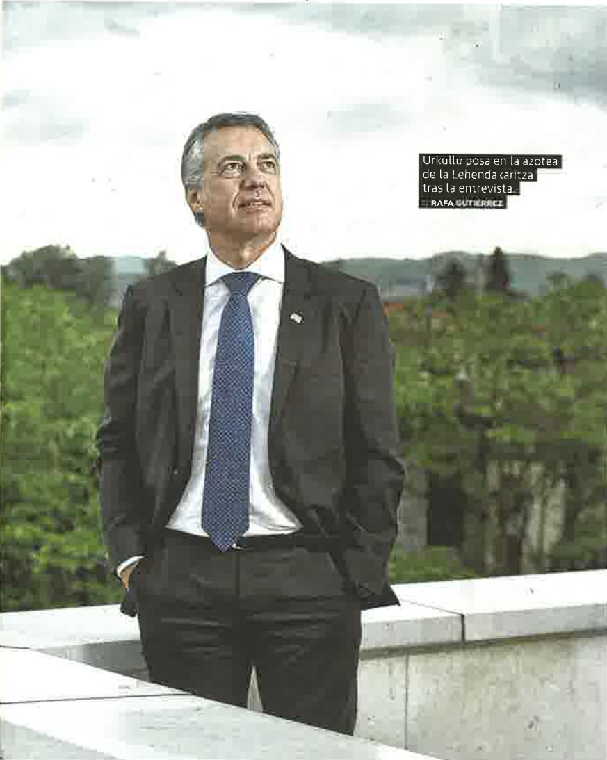
Urkullu posa en la azotea de la Lehendakaritza tras la entrevista.