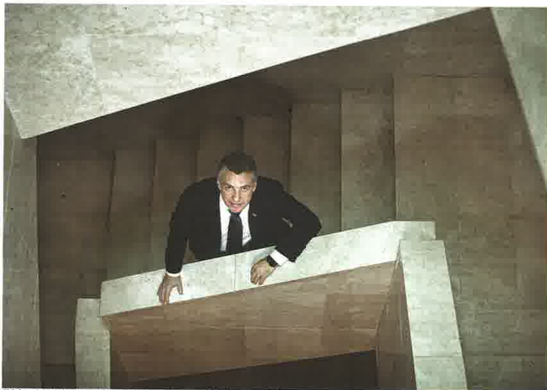
El lehendakari da total validez a la entrega de armas de ETA, aunque falte parte de su arsenal.

– El acuerdo denota voluntad de diálogo. Ya veremos si también de acuerdo.