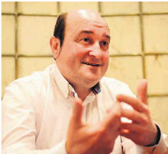
El presidente jeltzale, en un momento de la entrevista.

– En los sindicatos de la Ertzaintza hay mucha pose, todos sabemos quiénes están detrás. Podían haber hecho esto mismo con el anterior Gobierno y no lo hicieron. El lehendakari tiene derecho a expresar sus sentimientos.