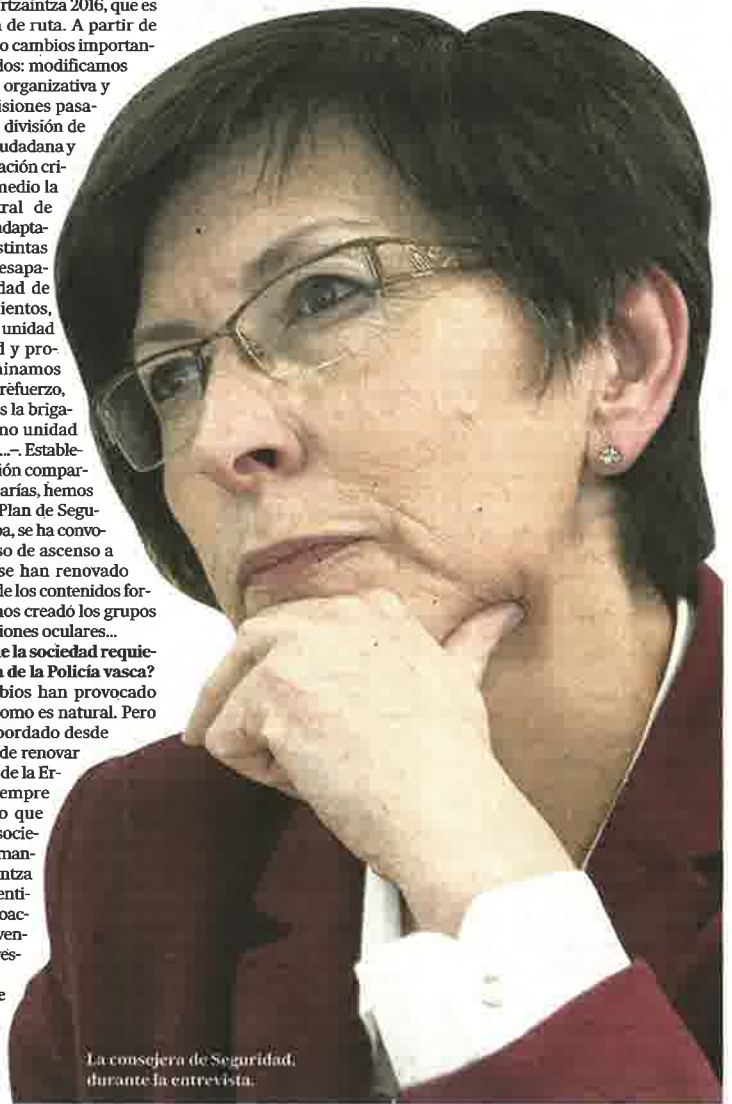
La consejera de Seguridad, durante la entrevista.

—Esa es una valoración que tendría que hacer la ciudadanía. Uno de los programas que pusimos en marcha el año pasado fue Ertzaintza Kalean, es decir, más ertzainas patrullando en la calle, y dentro de ello las patrullas a pie, lo que llamamos korrikas. Es algo que se está implantando de forma generalizada en todas las comisarías y demarcaciones. ●