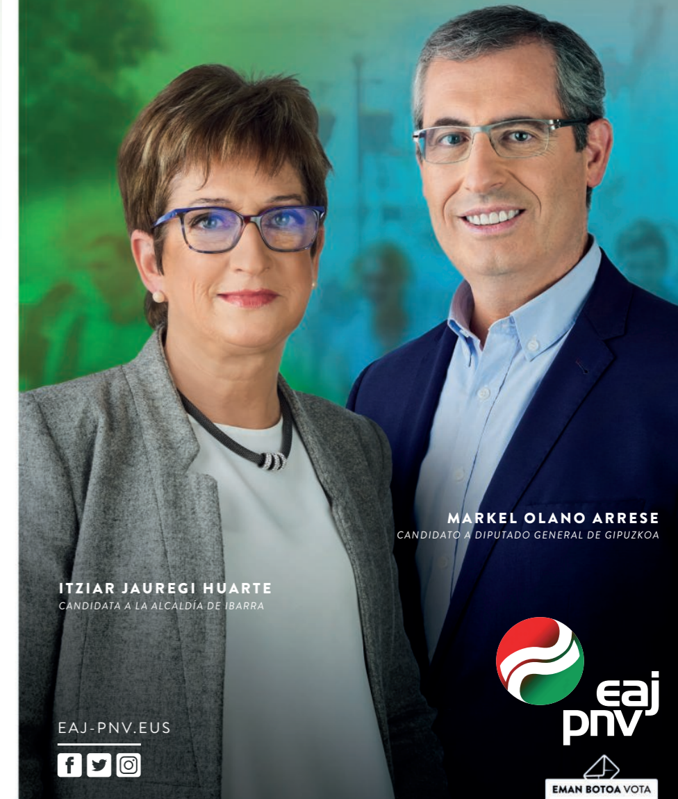
MARKEL OLANO ARRESE CANDIDATO A DIPUTADO GENERAL DE GIPUZKOA