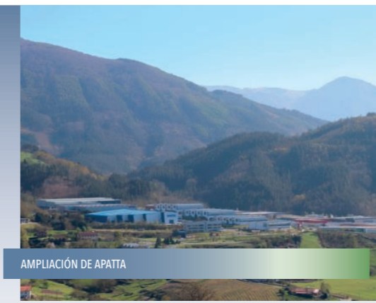
AMPLIACIÓN DE APATTA

Tenemos un entorno rural valioso en Ibarra y realizaremos trabajos de mejora y mantenimiento. Mejoraremos las infraestructuras, los sistemas de comunicación y los equipamientos en el medio rural con el objetivo de conseguir un mejor equilibrio con el núcleo urbano.