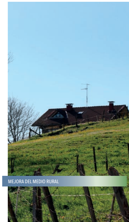
MEJORA DEL MEDIO RURAL

Aumentaremos la partida presupuestaria para el óptimo mantenimiento de calles, parques y mobiliario urbano. Realizaremos un listado de personas desempleadas interesadas en colaborar en la limpieza y mantenimiento de Ibarra. La limpieza de Ibarra tiene que ver con la conciencia de todos y todas.