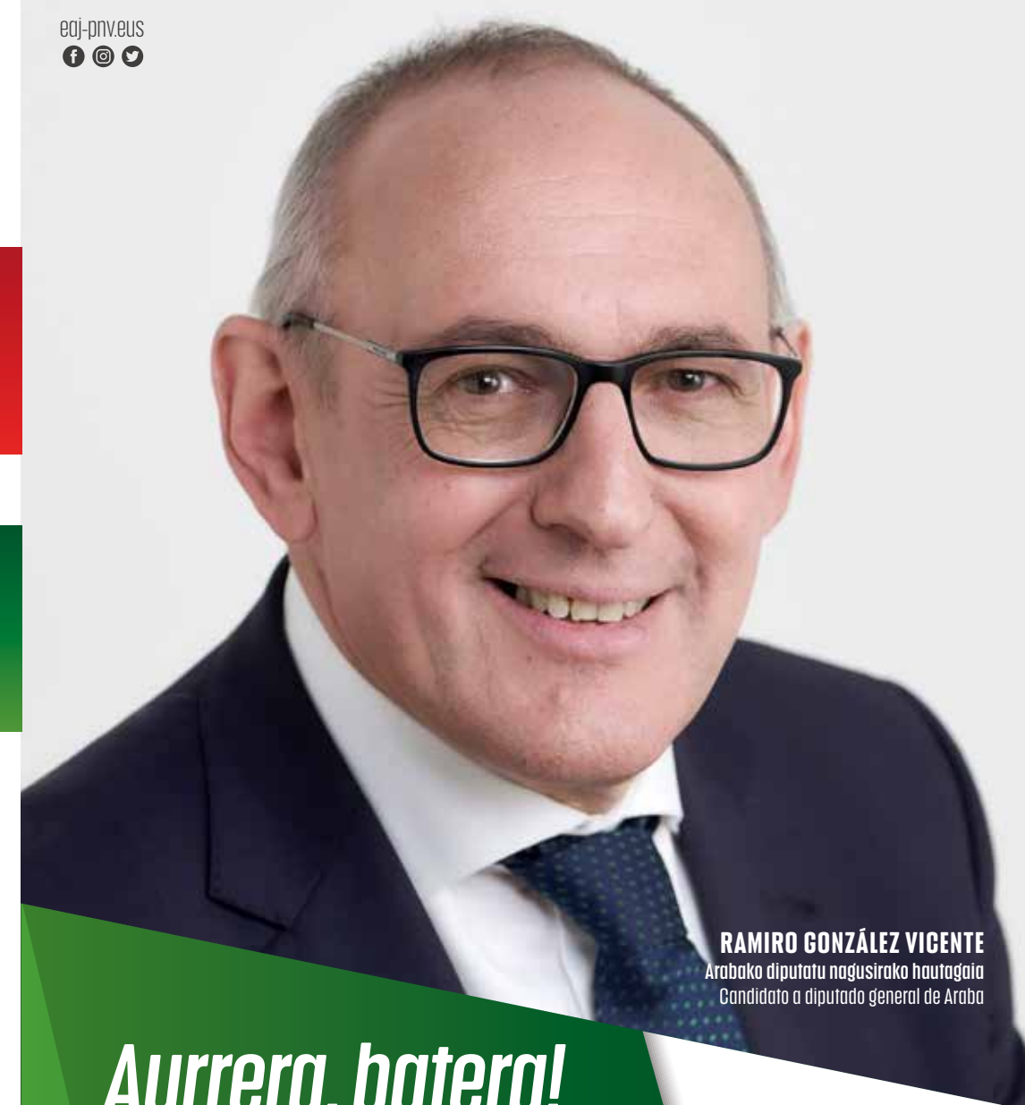
RAMIRO GONZÁLEZ VICENTE Arabako diputatu nagusirako hautagaia Candidato a diputado general de Araba

10 Gure adinekoen etxez etxeko laguntza hobetzea, Arabako Foru Aldundiarekin koordinatutako planaren bidez. Mejora de la asistencia y ayuda a domicilio para nuestros mayores en el marco de un plan coordinado con Diputación Foral de Álava.