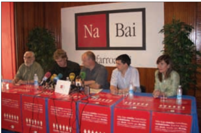
Representantes de los partidos de Nafarroa Bai y Uxue Barkos en rueda de prensa